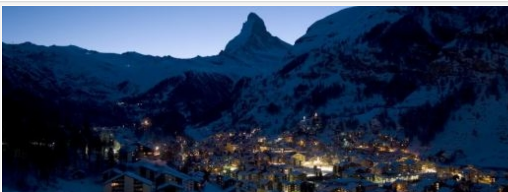
Skyrunning, Zermatt, http://www.ultraks.com

Matterhorn Ultraks , bo tak brzmi pełna nazwa biegu, to 46km z całkowitym przewyższeniem 3600 m . Najwyżej położony punkt znajduje się na wysokości 3100 m. n.p.m. i to na nim prawie zawsze tworzy się biegowy kocioł. Nawet będąc mocno w biegu, nie wolno odpuścić sobie rozciągającego się, niezapomnianego widoku.