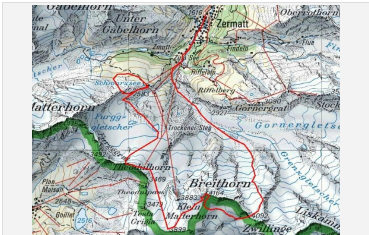
Skyrunning, Zermatt, ultraks.com