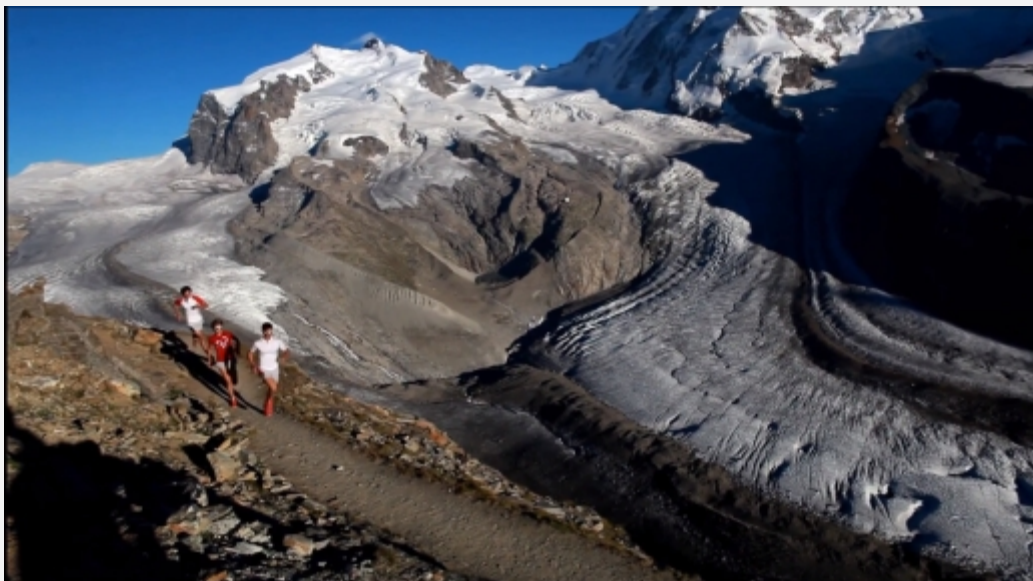
Skyrunning,, Zermatt, hikingonthemoon.com

O miejscowości, w której zostanie rozegrany 4 bieg z cyklu SKY nie będę się rozpisywał. Zermatt dla nas biegaczy to góra marzeń, na którą raz w życiu musimy wbiec. Wielkie słowa nie oddają w pełni niezwykłego wysiłku włożonego w przygotowania do startu, lecz w biegowym cv pozycja ta może stanowić najważniejszą.