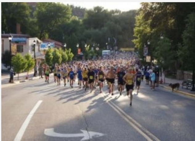
Skyrunning Pikes Peak Marathon