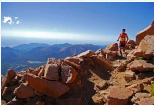
Skyrunning Pikes Peak Marathon