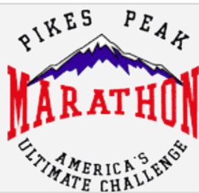
Pikes Peak Marathon

Najlepsze góry to macie w Europie - mówią nam amerykańscy biegacze spotkani na znajomych górskich ścieżkach. Tymczasem trzeci z głównych biegów z cyklu SKY rozgrywany jest w USA.