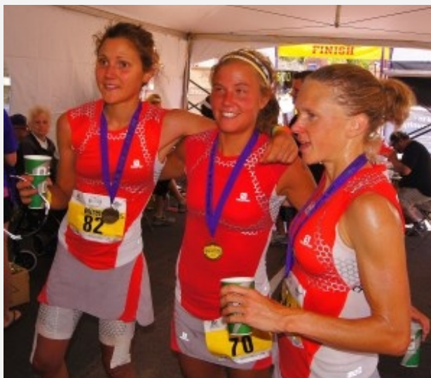
Skyrunning Pikes Peak Marathon, pikespeaksports.us