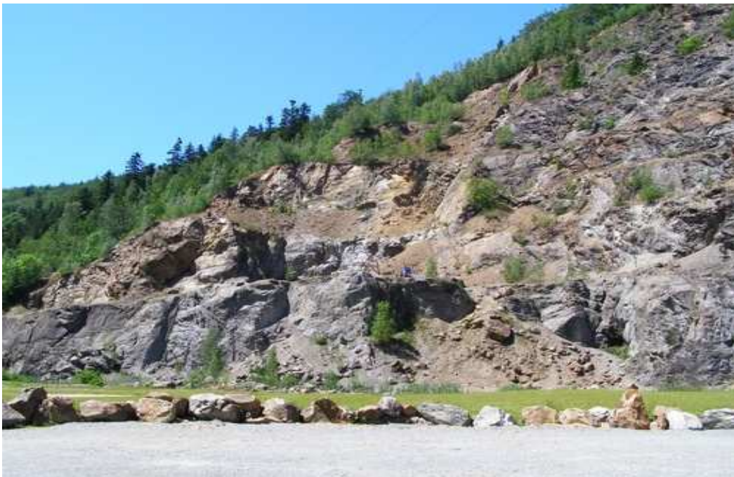
Były kamieniołom w Złotym Jarze

Wiódł on pętlą przez pełne uroku uliczki starego miasta, by z powrotem wrócić na rynek, skąd już rozpoczynała się droga prowadząca wprost na szlak, poprzez teren byłego kamieniołomu gdzie powstał największy park linowy w Polsce – Skalisko .