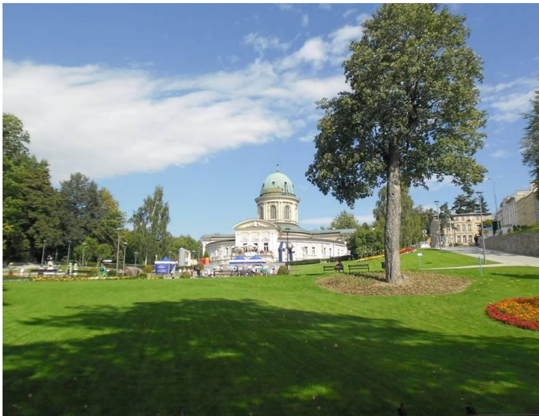
To właśnie tutaj, 17 września rozegrana została 4 edycja cyklu biegów górskich Mountain Marathon 2011 .