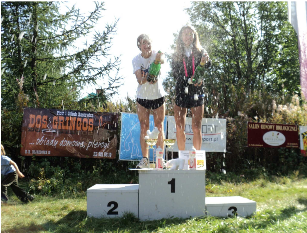
Celebracja zwycięstwa na szczycie Magurki w stylu Formuły 1.

Ania miała podwójny powód do świętowania, gdyż dwoma weekendowymi zwycięstwami praktycznie zapewniła już sobie zwycięstwo w Lidze Biegów Górskich 😊.