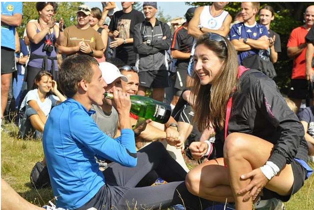
Reszta szampana, która pozostała nie zmarnowała się bynajmniej ...